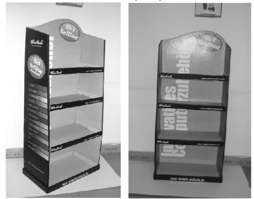
Montage Parts' installation